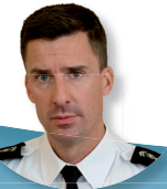
Commandant du groupement de gendarmerie départementale Colonel Aurélien Ardillier

Sécurité des personnes, des biens et des institutions, lutte contre la délinquance, lutte contre les violences urbaines et l'insécurité routière