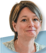
Sous-préfète de Lorient Florence Bessy

Sous-préfète de l'arrondissement de Pontivy