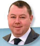
Secrétaire général Sous-préfet de Vannes Stéphane Jarlégand

Sous-préfète en charge de l'ensemble des missions touchant à l'ordre public, à la prévention des accidents et à la gestion des crises, en liaison étroite avec les services de police, de gendarmerie et de sécurité civile